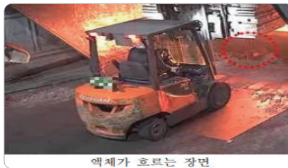
액체가 흐르는 장면

'20.6. 원자재를 용해로에 넣는 작업 중 자재에 고여 있던 물이 수증기로 폭발하여 사망