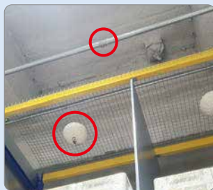
■ 각 격리공간 소화설비 설치