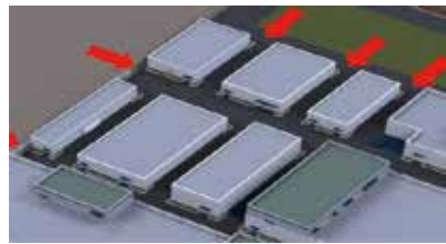
건물 간 안전거리 확보