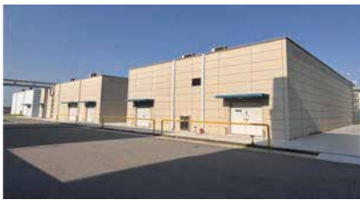
철근 콘크리트 단층 구조 공장 건축