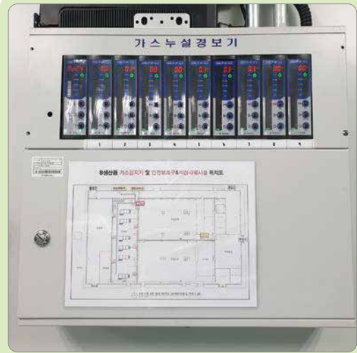
■ 화재(가스) 감지·경보 장치 설치