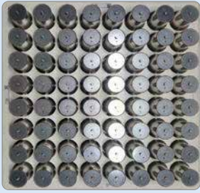
■ 난연 재질 트레이(Tray) 사용