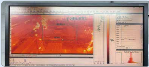
■ 열화상카메라로 발열 여부 점검