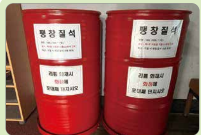
■ 소화약제 구비