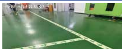
피난 유도선 설치