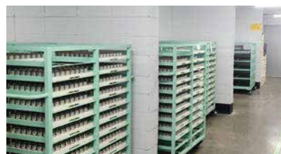
콘크리트 격벽 설치, 전지 분산 보관