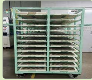
■ 철재 대차를 이용하여 전지 보관·이송