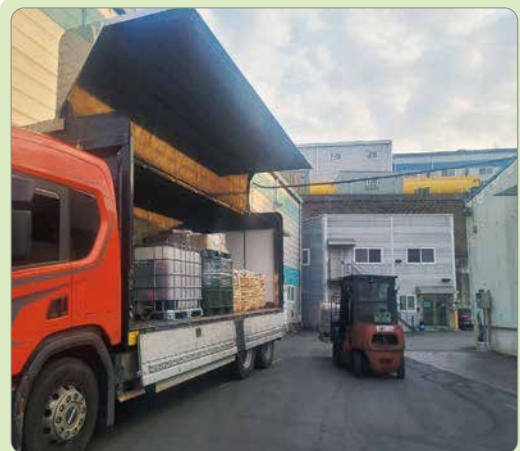
■ 우천 시 운송을 피하고 덮개 차량 이용 ■ 상·하차, 보관 시 충격·낙하 주의