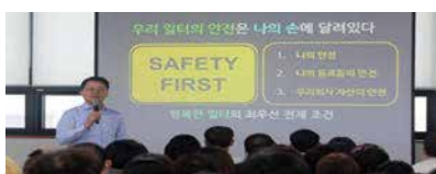
CEO 안전 교육