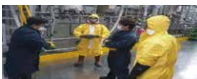
화학사고 대응 훈련