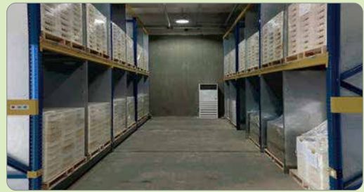
■ 격벽을 설치하여 전지 분산 보관