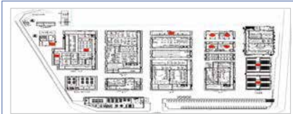
즉시 대피 구역 ●