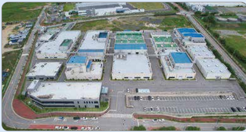
■ 철근콘크리트 단층 구조물로 건축 ■ 건물 간 안전거리 확보