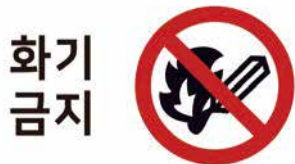
■ 화기 접근, 물 접촉 금지